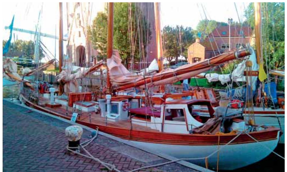
Foto links: De Carrina voor de restauratie onder vol tuig tijdens de Shipmate Classic Yacht Regatta in Hellevoetsluis. Onder: De Carrina na restauratie in Enkhuizen tijdens de Klassieke Flevo Race 2010.

Christopher had het toen over een Nederlander die het schip misschien wilde kopen. Iemand die al een paar keer was komen kijken en die schijnbaar ook al voor de charmes van de Carrina was gevallen, maar met wie hij het niet eens kon worden over de prijs. Ik begreep hem wel. Hoe kan je afscheid nemen van een schip dat een deel van je leven is geworden en