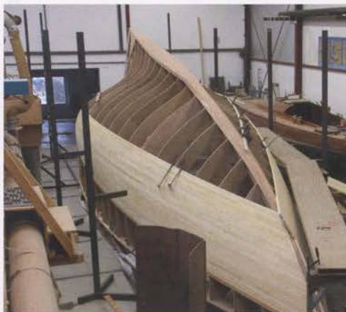
De huidlatten, voorzien van vingerlassen, worden aangebracht.

Het opstellen en bespreken van de offerte kostte twee maanden. Begin december 2015 viel het besluit en kon de bouw beginnen. Alles bij elkaar gaat het om ruim anderhalf jaar werk. Eerst werd een bouwframe in elkaar gelast waarop het (hulp)spantenraam werd geplaatst; de romp werd op z'n kop