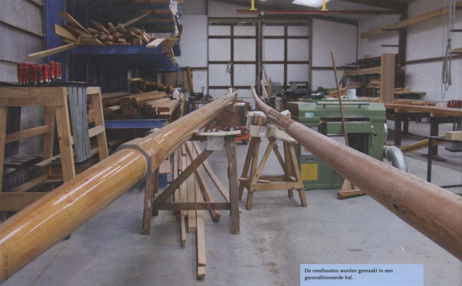
De rondhouten worden gemaakt in een geconditioneerde hal.

naar meer diversificatie ontdekte hij dat er vraag was naar houten lantaarnpalen, die onder meer in eco-wijken geliefd zijn. Die worden nu ook in eigen huis geproduceerd.