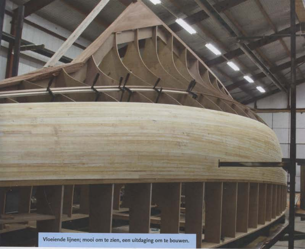
Vloeiende lijnen; mooi om te zien, een uitdaging om te bouwen.

gebouwd, dit overigens in tegenstelling tot de oorspronkelijke Impala. Daarna werden de huidlatten, voorzien van vingerlassen, aangebracht. Een volgende stap is het bekleden van de romp aan de binnen- en buitenkant met glasvezel aramide-weefsel met epoxy, wat VMG Yachtbuilders (voorheen Zeeman) in Enkhuizen uitvoert. Tijdig het juiste hout, zoals mahonie en yellow cedar voor de huid, in huis hebben is cruciaal voor een vlotte voortgang. Voor de deksplanken ging Baars op zoek naar kromgegroeide stammen Frans eiken. "Als je een stam vindt die in de juiste vorm is gegroeid, is die makkelijker te verwerken en gaat je rendement met sprongen omhoog..."