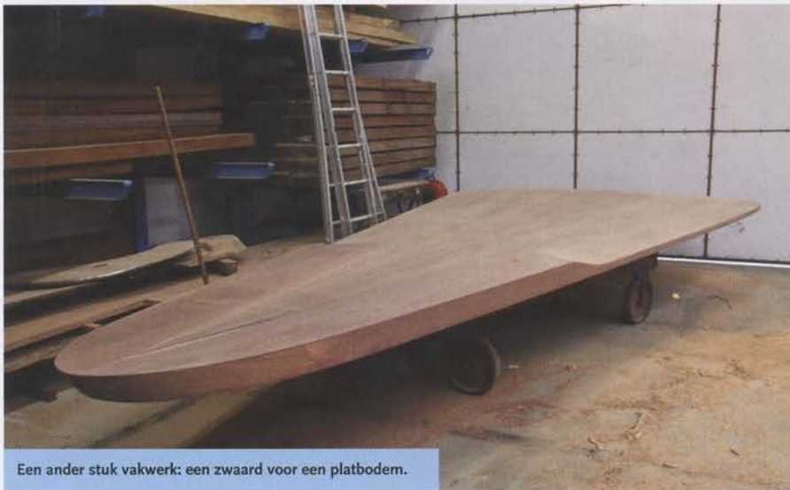
Een ander stuk vakwerk: een zwaard voor een platbodem.

De productiehal in Enkhuizen waar de masten worden gemaakt, is geklimatiseerd met een constante temperatuur. Dat gebeurt op energie-efficiënte wijze: voor de vloerverwarming wordt gebruik gemaakt van een warmtepomp en IJsselmeerwater. Door de geconditioneerde omstandigheden zijn de verlijmingscondities goed en constant en daardoor kun je volgens Baars de wanddiktes van de masten optimaliseren. Want de masten zijn niet meer massieve stammen, maar worden nauwkeurig samengesteld en verlijmd. Bepalend voor het gewicht en de sterkte zijn de kwaliteit van hout en hoe dat 'georiënteerd' is; dat wil zeggen hoe de jaarringen lopen. Baars laat een monster zien waarin behalve Spruce ook Massaranduba, Braziliaans hardhout, is verwerkt. "Stengen bijvoorbeeld moeten niet alleen licht, stijf en sterk zijn, maar