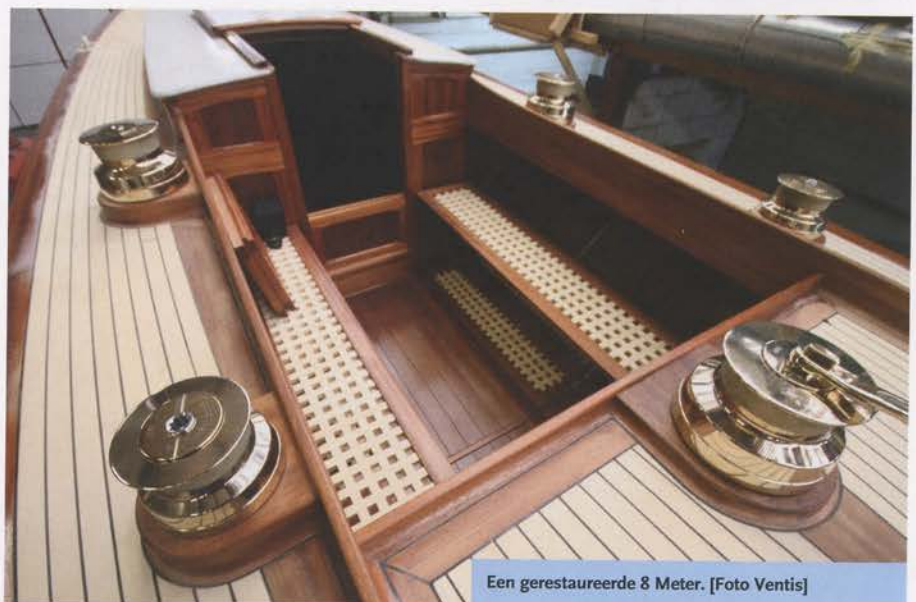
Een gerestaureerde 8 Meter.

Tenslotte worden de planken geruime tijd aan de lucht gedroogd alvorens ze verder worden verwerkt. Baars: "Iepenhout is licht van kleur en het leent zich goed voor interieurs. Los daarvan: we geven iets dat anders verbrand zou worden, weer een hoogwaardige functie. Er varen inmiddels vele klippers en jachten met een betimmering van Enkhuizer Iepen"