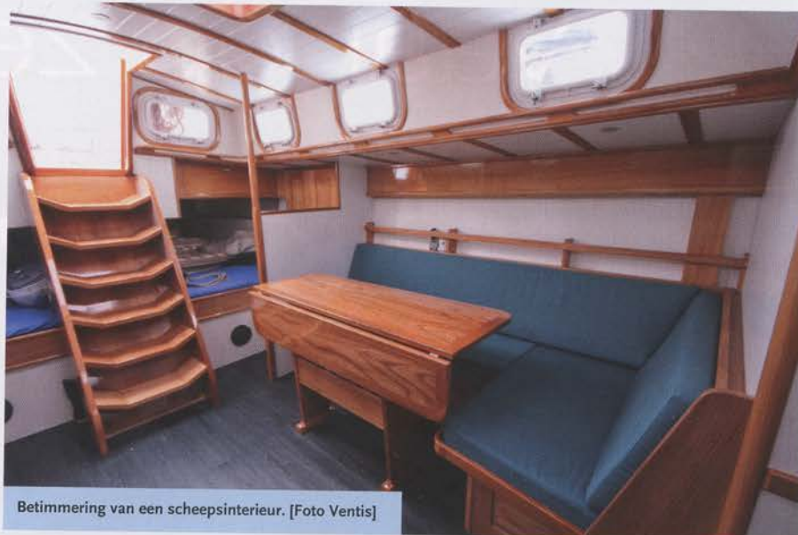
Betimmering van een scheepsinterieur.