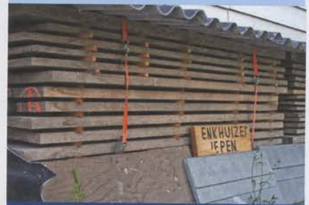
Enkhuizer iepen-hout ligt te drogen.

Een andere stap was de overname van Brasker Masten. Aangevuld met de winterstalling speciaal voor klassieke houten jachten (twee hallen van respectievelijk 500 en 400 vierkante meter) en de bijbehorende serviceklussen, heeft het bedrijf een stevig fundament. Hij boorde ook nieuwe markten aan. Zoekend